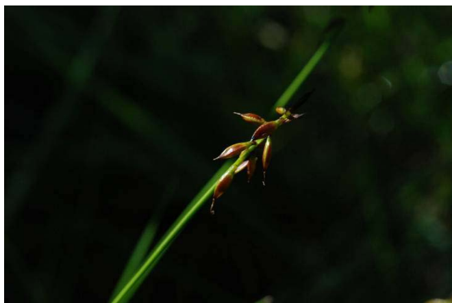
Loppstarr i Merhultskärret

I Uppvidinge kommun finns ett myrområde, som är 4 ha stort. Större delen av området är fattigkärr med myrlilja och vitmossor. I sydöstra delen finns emellertid flera mineralrika källor (t.ex. 6302200/1464869), som översilar ett stort svagt sluttande källkärr med en storlek av ca 1,5 ha.