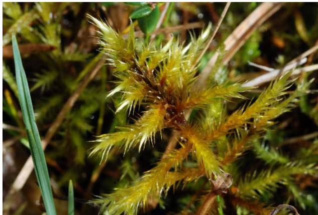
Gyllenmossa i Merhultskärret

På kospillning fanns komossa. Rikkärrsarterna tycks ha klarat sig bra. Anledningen till det är troligen att kärret har hållits öppet genom slåtter tidigare och genom bete under senare år. Området är unikt i Kronobergs län och av reservatsklass.