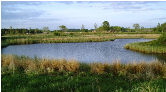
”Svansjön” i maj 2008

Text: Lennart Swahn