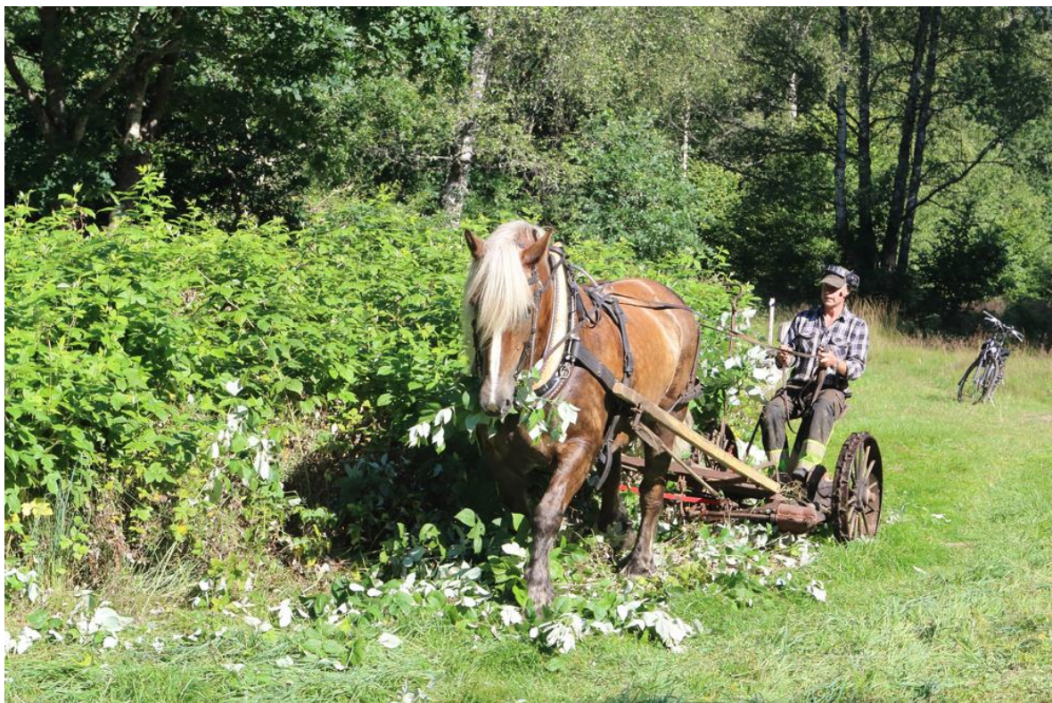
Miljövänlig slätter i Bruntes hage

Naturskyddsföreningen i Alvesta har sedan 1995 skött ängen vid Blommagård, den som ofta benämns Bruntes Hage. Genom att röja på våren och i slutet av sommaren slå med lie eller med hjälp av slätterbalk för att sedan ta bort höet, har vi förhindrat att buskar, gräs och storvuxna blommor tagit över och i stället har en mångfald blommor samt insekter kunnat trivas i hagen. Några år har också bränning testats.