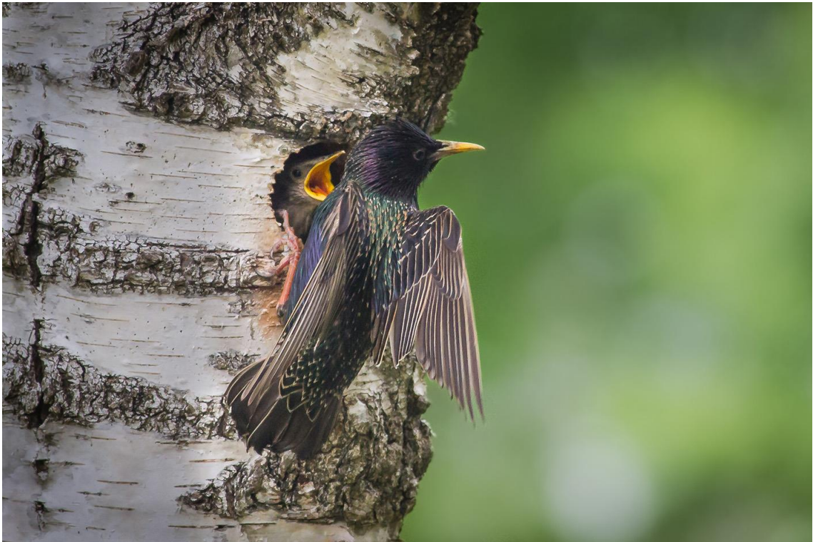
Hackspettshålets nya invånare: starar