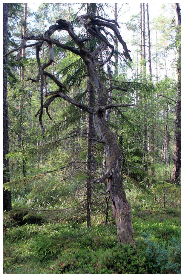
Tallskogen i november