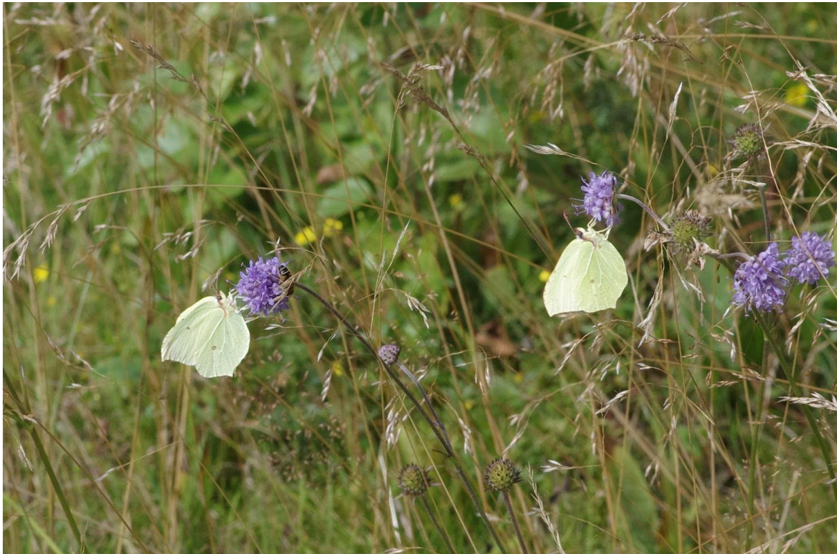
Ännu ett foto från vår fototävling Pollinerare