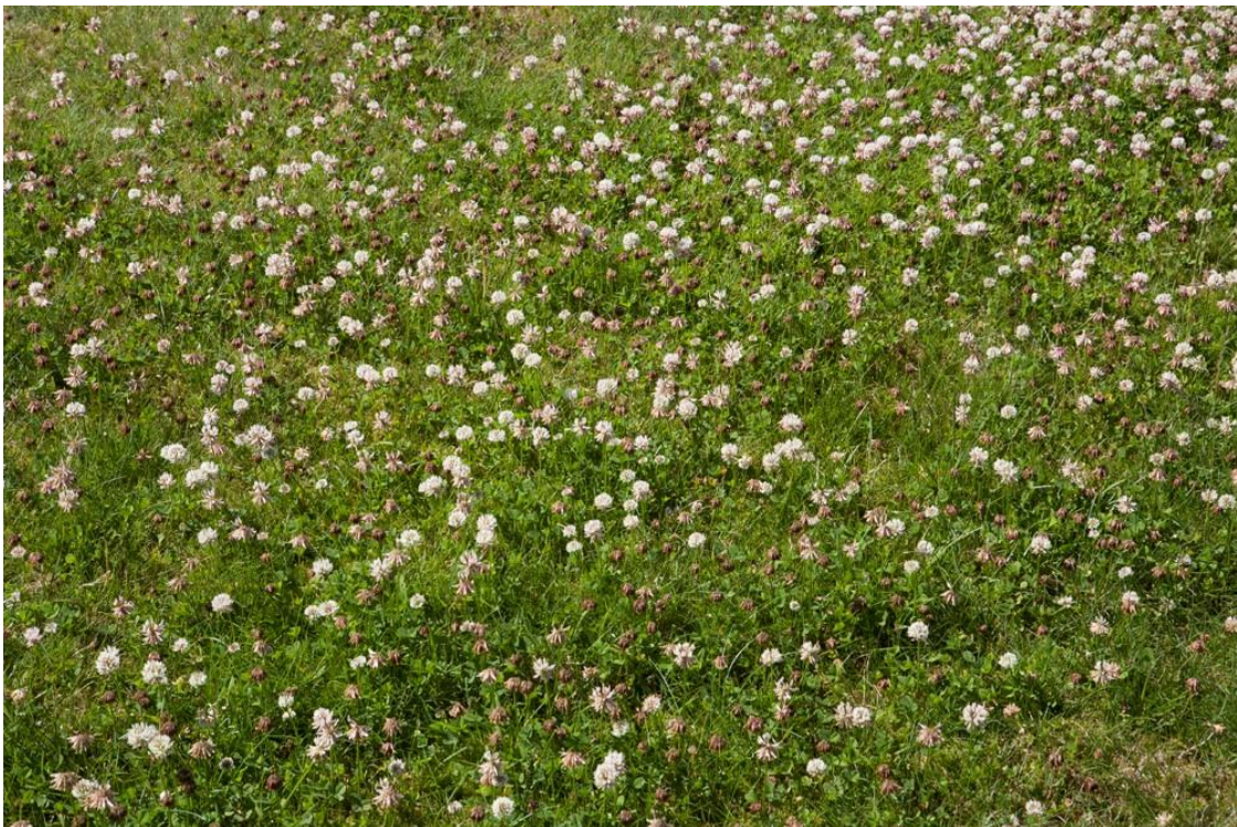
Godis för humlor hos en granne som klipper med "vanlig" gräsklippare.

Många vildbin och humlor har minskat kraftigt så kan man gynna dom i sin trädgård är det bra. Humlorna bor gärna i hål i gräsmattan eller i hålrum i omgivande träd. De första honorna som kommer fram tycker om min lungört . Humlorna gillar sedan klöver i gräsmattan och gurkört i landet.