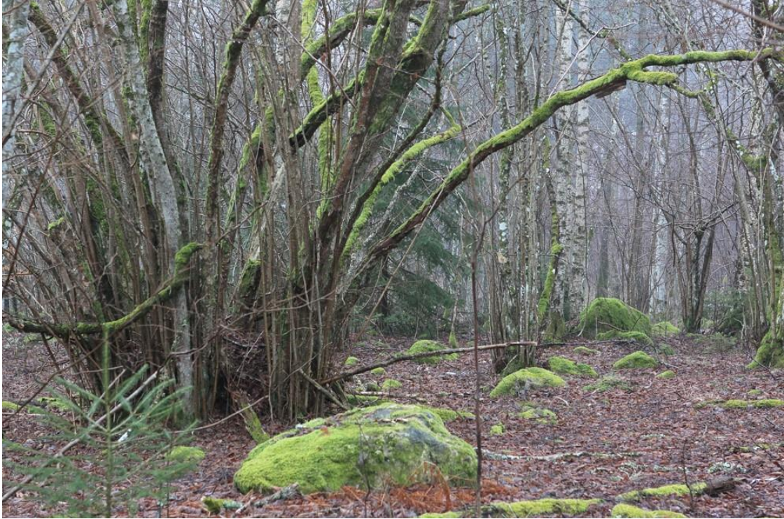
Hasselskog vid Spåningslanda

Hela medborgarförslaget kan läsas på vår webbplats.