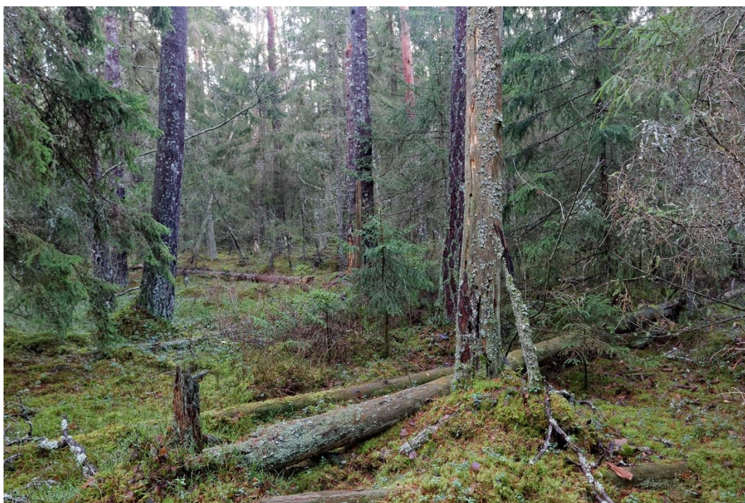
Flerskiktad och olikåldrigt med död ved: kännetecknen för naturskog.

Skogen är en riktig pärla i Alvesta eftersom den ger möjlighet att uppleva naturlig skog så tätortsnära. Skogen är olikåldrig, flerskiktad, har mycket död ved, rotvältor och olika fuktighet. Då den ligger nära tätortens skolor är den