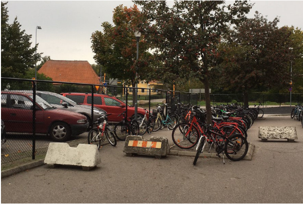
Elevens cyklar vid Prästängsskolan, mindre än 200 meter från tåkttransporterna vid rondellen.