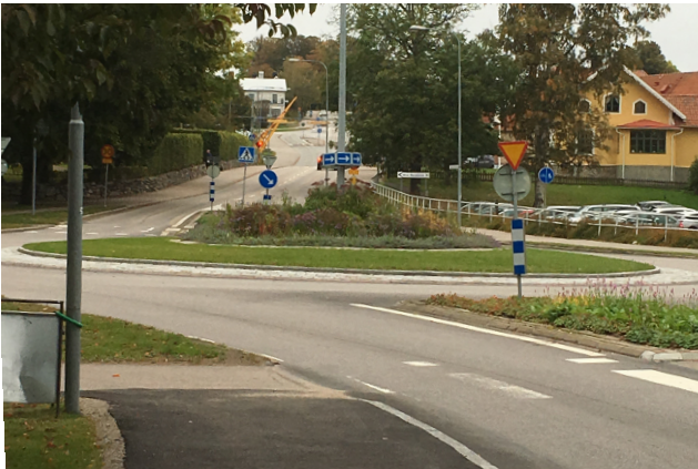
... rondellen där tåkttransporterna skall passera.