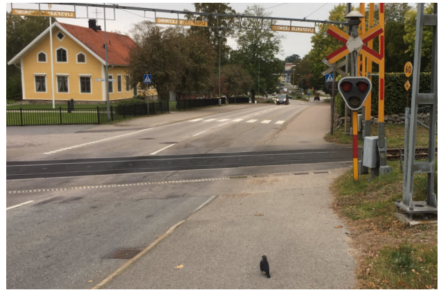
Här cyklar eleverna ner för backen över järnvägsövergången och till...