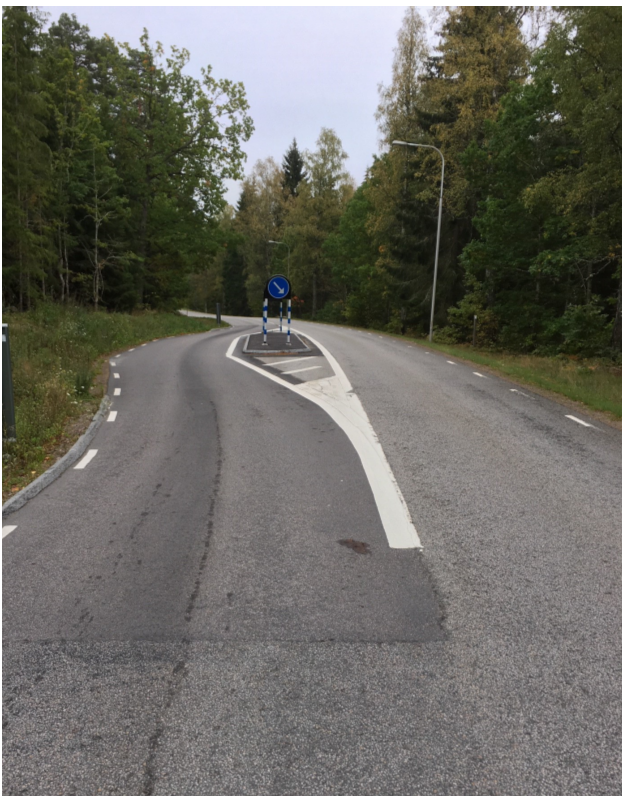
Smal och svårpasserad passage (även för personbilar) vid infarten till Alvesta, Växjövägen.