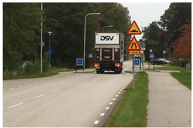
Trång passage med boende på höger sida och friluftsområdet Sjölyckan till vänster.